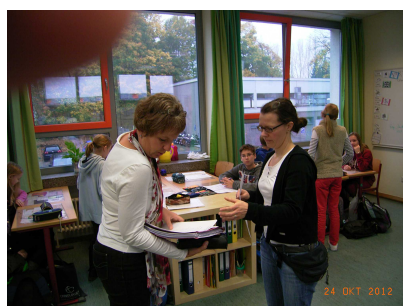
Lehrkraft und Förderlehrkraft arbeiten Hand in Hand