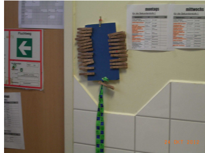
Die Klammer – das Zeichen für den Lehrer, dem jeweiligen Schüler zu helfen

In den folgenden Monaten wird sich die FESH- Steuergruppe Schulprogramm an Hand der motivierenden Berichte auf den Weg machen, den Schulgremien neue Vorschläge zu unterbreiten. So wird die FESH engagiert in die Zukunft gehen.