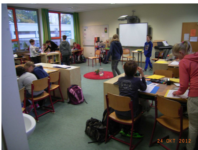
Voll ausgestattete Klassenräume mit Nebenräumen